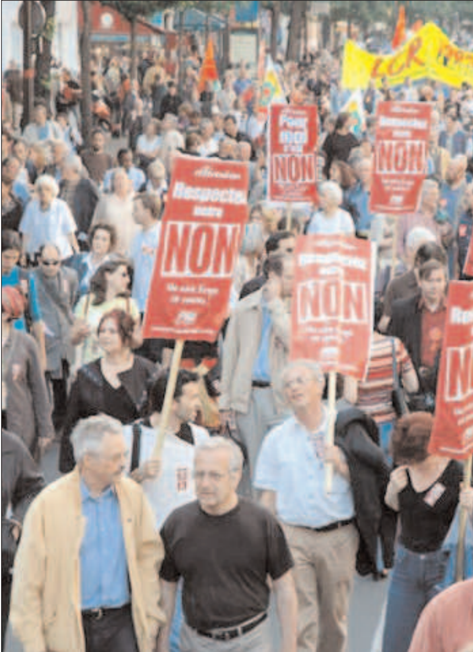
Manifestación contra la constitución europea en Francia

viene de la página anterior mismo tiempo que es la reunión de los ejecutivos nacionales. Los grupos de presión seguirán desempeñando un papel esencial, y los miembros de la Comisión no podrán ser elegidos o cesados por los parlamentarios. El derecho de iniciativa ciudadana queda en una declaración de intenciones no definidas. En cuanto al Banco Central Europeo (BCE), escapa a todo control democrático, y conserva como único objetivo la estabilidad de los precios, promovido al mismo rango que el resto de los objetivos de la Unión.