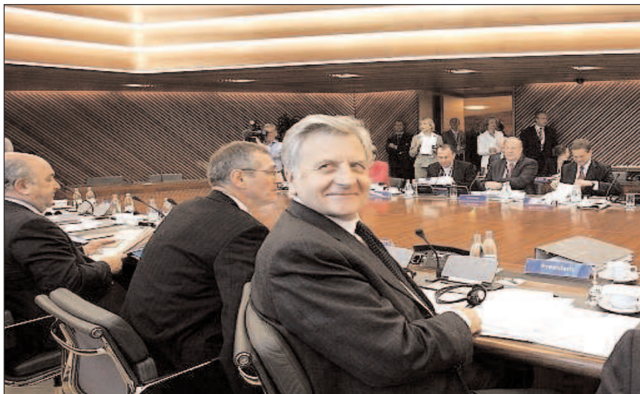
El presidente del Banco Central Europeo en una visita a Madrid