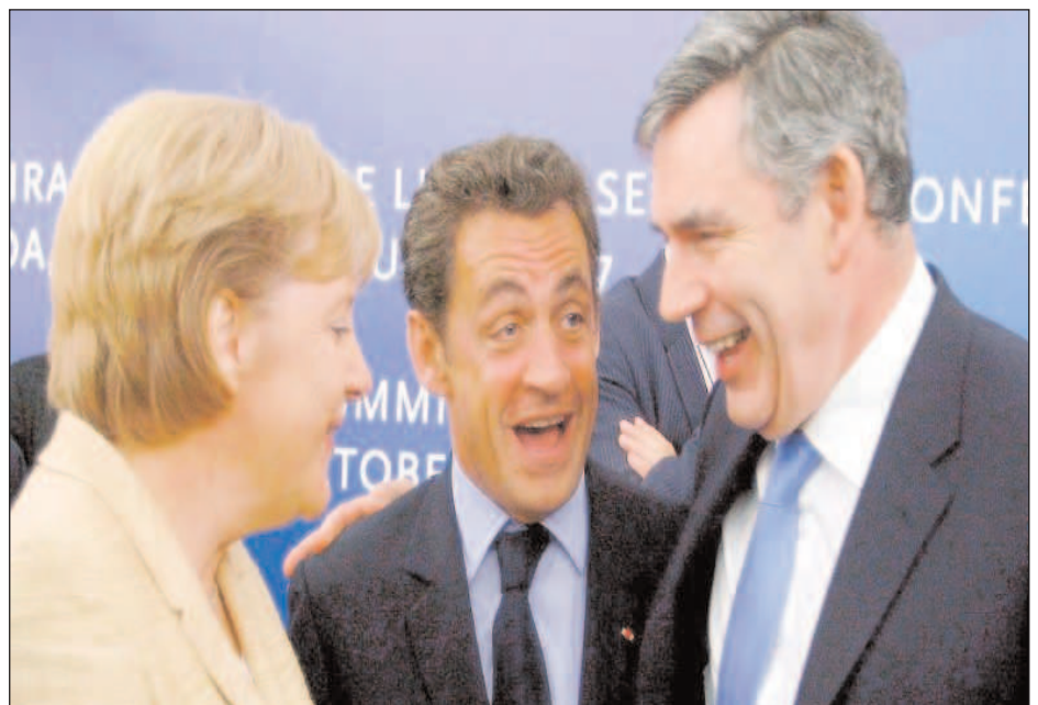
El primer ministro británico, Gordon Brown bromea con el presidente francés, Nicolas Sarkozy y la canciller alemana, Angela Merkel en Lisboa