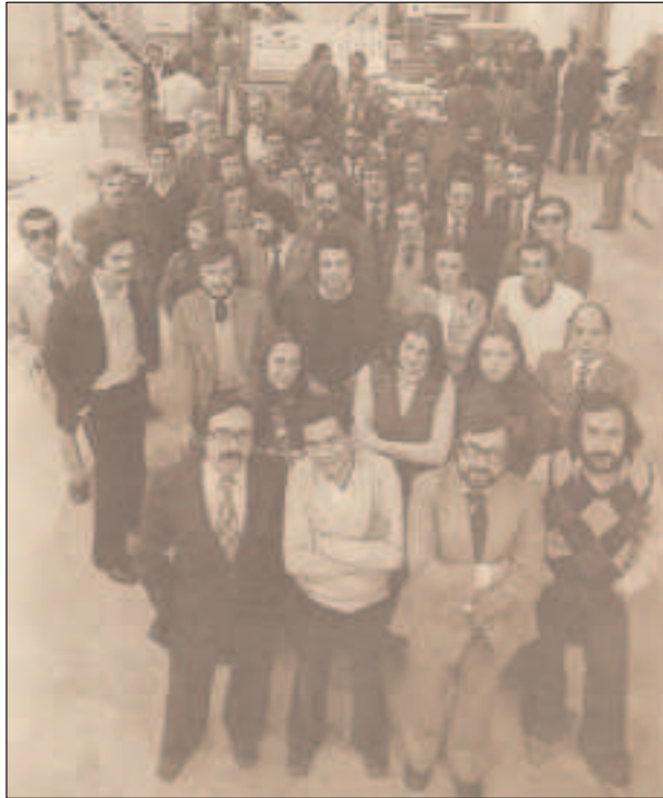
Primera redacción de El País

Toda regla tiene su excepción y esta traición a los lectores no supondrá la supervivencia ineludible del periódico. No soy el único que piensa así. Muchos han dejado de leerlo y para la derecha El País es un periódico maldito.