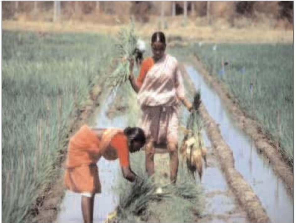
Cultivando arroz en la India

Esta bajada de tipos estimuló la siguiente burbuja: la inmobiliaria: la gente podía endeudarse y comprar propiedades inmuebles, cuya demanda creció. La subida de precios y la posibilidad de obtener fáciles ganancias hizo que el inmueble se convirtiera en una mercancía de inversión, así como el mismo crédito para adquirirlo (las hipotecas). Esta escalada de precios, además de perjudicar a las rentas más bajas, pervirtió el sistema económico induciéndole a construir más casas de las que se podían habitar, o a los bancos a ofrecer hipotecas a quien no podía pagarlas. En el momento en que la subida del