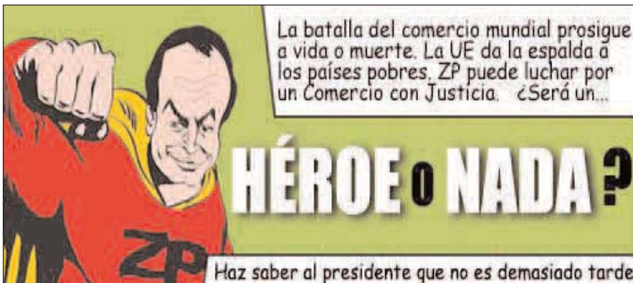
Campana de Intermon Oxfam