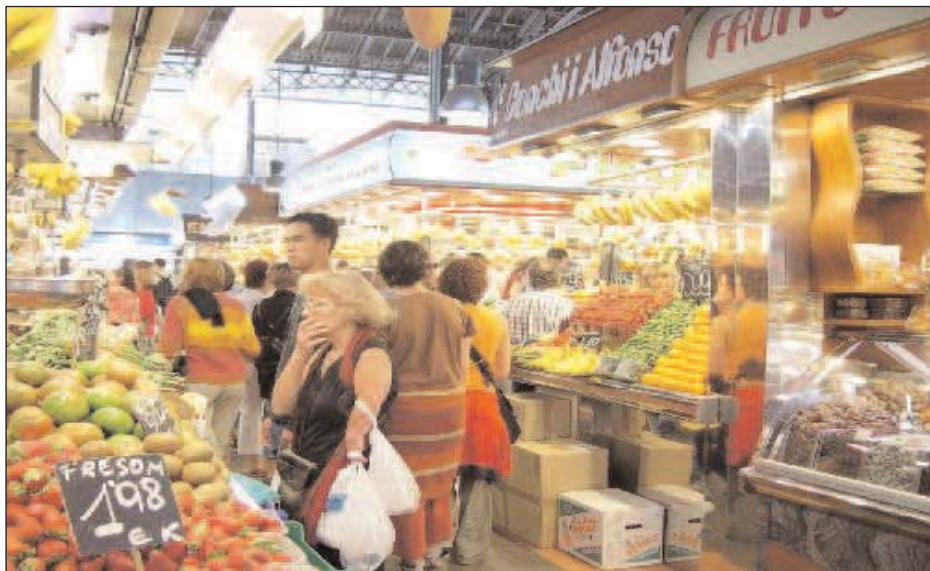
Compradores en el mercado de la Boquería en Barcelona